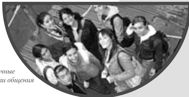
различные возможности общения